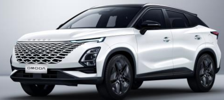
Carbon crystal black & Khaki white