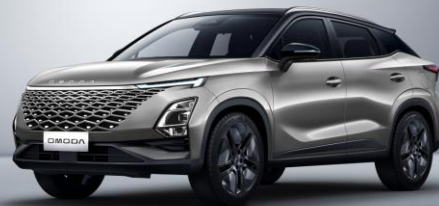
Carbon crystal black & aviation silver