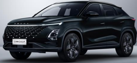
Carbon crystal black