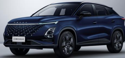
Late night blue